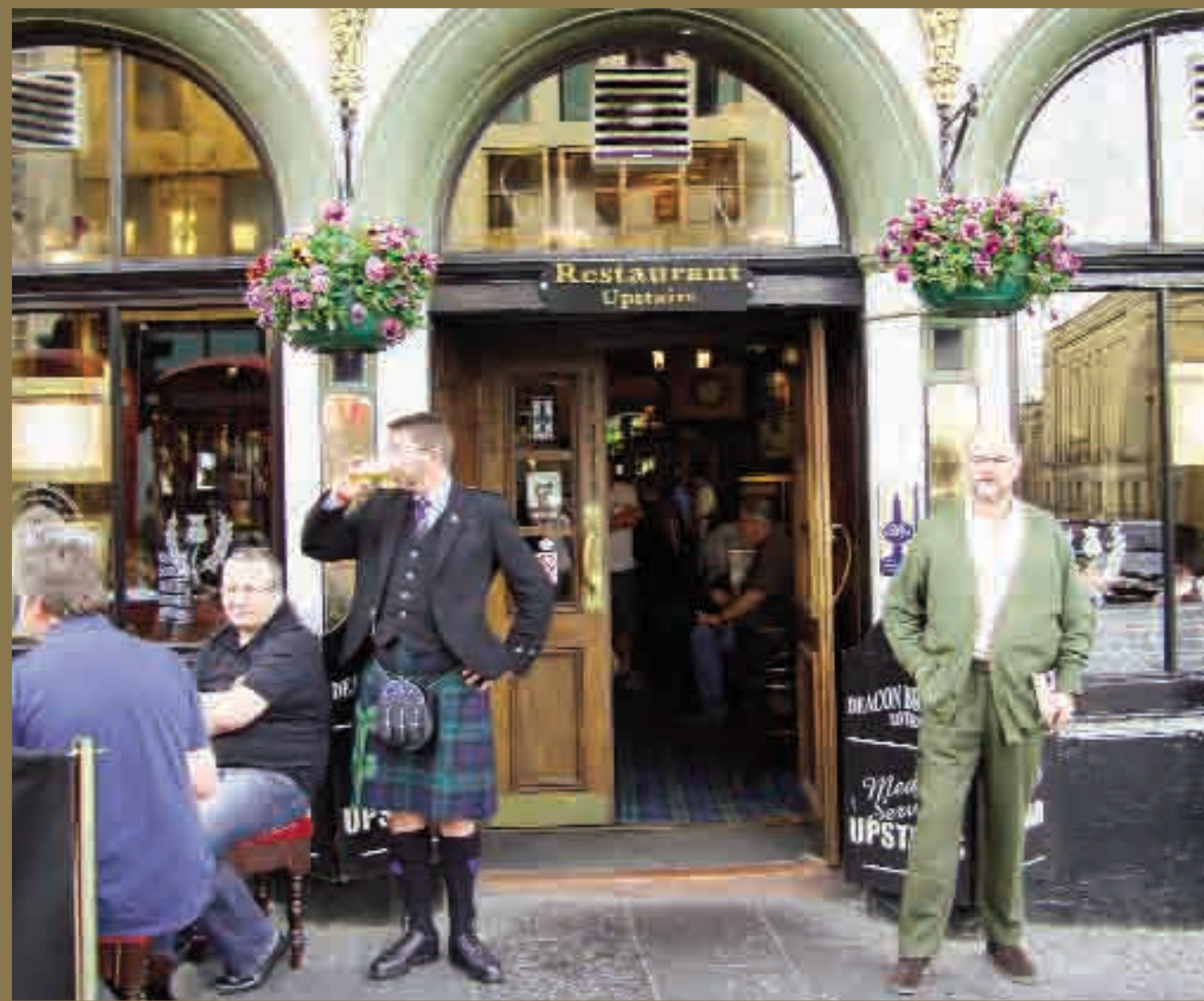
El famoso pub Deacon's Brodies Tabern en la Royal Mille.

espaciosa, con antiguos muebles, con camas con dosel y papeles pintados con ventanales que dan a los prados y bosques que rodean la construcción. Lo más curioso es que en vez de números, cada habitación lleva el nombre de una destilería, (pues casi se me olvidaba decirlo y eso que es el título de este artículo) estamos en la cuna y origen del mejor whisky escocés. Sí, la enorme calidad de las aguas que nos rodean, hace que la zona sea la cuna de las mejores y más antiguas bodegas del mundo. Uno de los ingredientes más importante para un buen caldo es el agua, que debe ser de primera calidad.