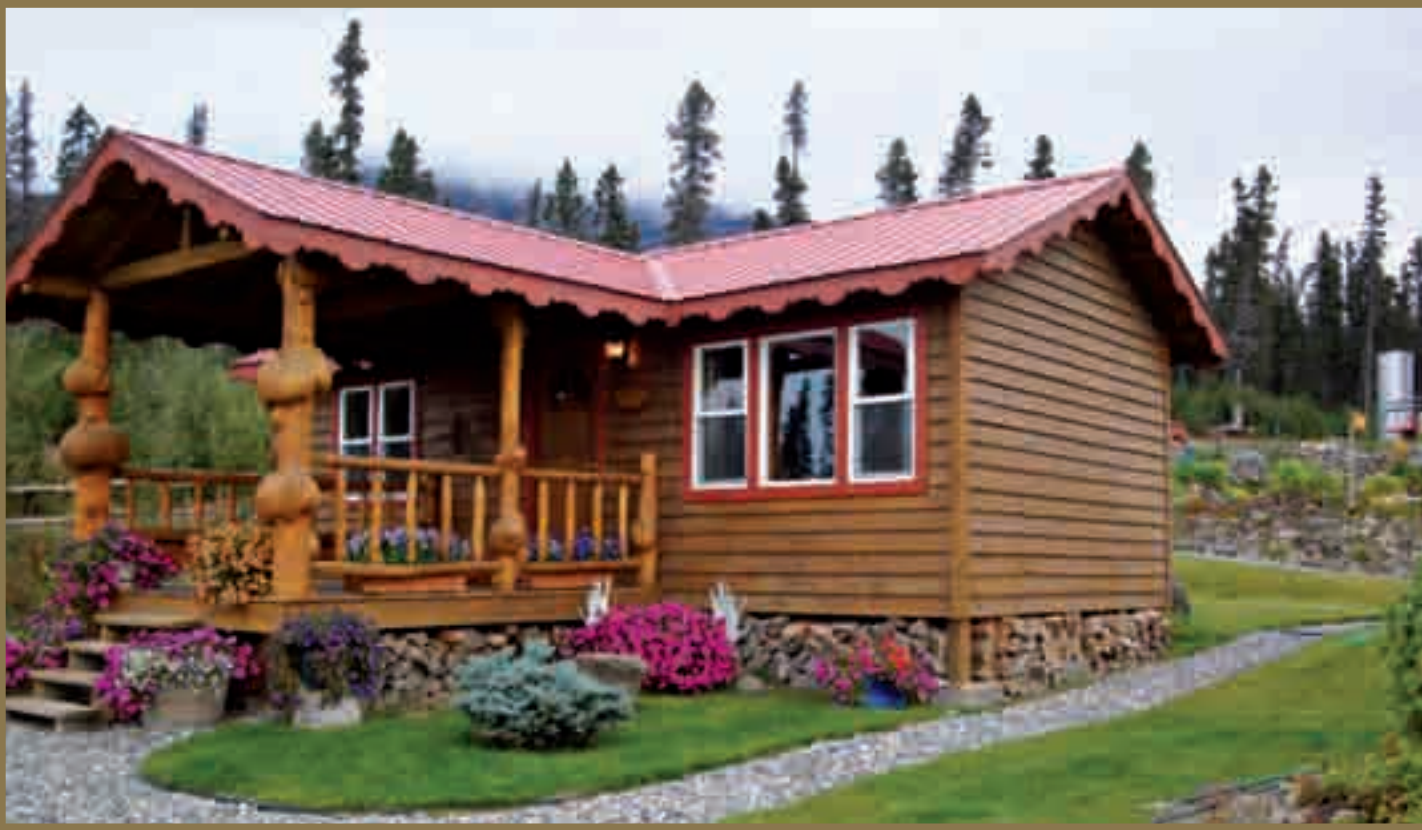
Una de las cabañas que componen el campamento base de la organización. Cada una tiene ducha, baño, dos dormitorios y un bonito cuarto de estar.