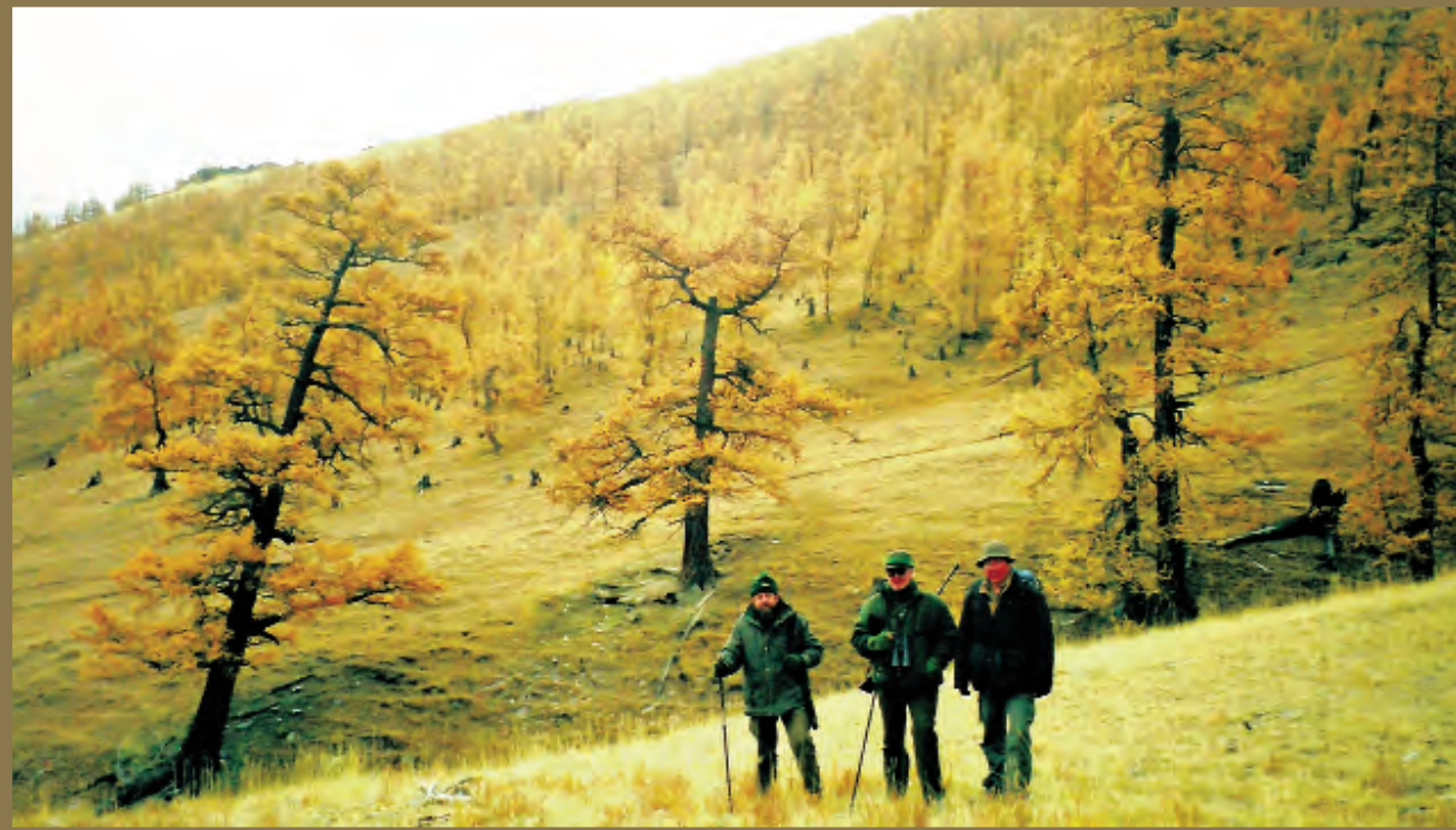
En los bosques de Bayan Olgi, en busca de marales.

to o en el coche, pues en el campo sólo le darán molestias. Lo normal es cobrar su íbex o su carnero en los dos o tres primeros días, pero sólo si ha contratado usted con una de las mejores agencias, pues la cantidad y calidad varía mucho de una zona a otra... La duración de la cacería dependerá de lo exigente que sea usted con la calidad de su trofeo, pero como he dicho si no es muy selectivo con la calidad, en pocos días tendrá su trofeo.