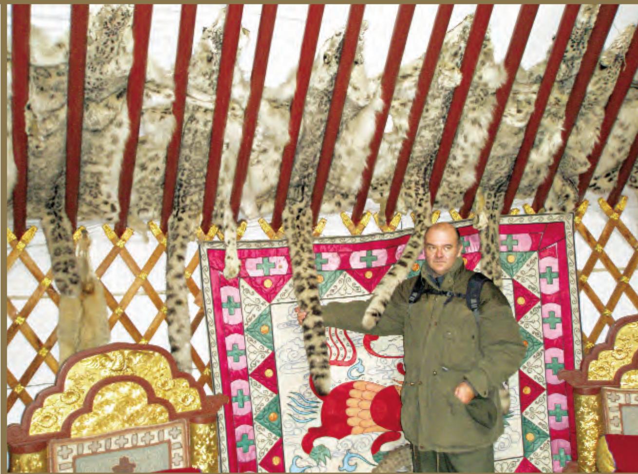
Pieles de leopardos de las nieves adornan una yurta.

Pero nunca he hablado, a pesar de haber guiado varios grupos de Armada expediciones de las exóticas cacerías en las montañas de Altai. Por ello hoy vamos a visitar este destino, sin duda una experiencia para un cazador de montaña que se precie. Veremos qué especies podemos perseguir, revisaremos cómo es el largo viaje, tanto en avión como en coche a este lejano cazadero, e intentaré explicarles la dureza y la belleza que creo que hacen que merezca la pena dar media vuelta al mundo para cazar en la tierra de Genghis Khan.