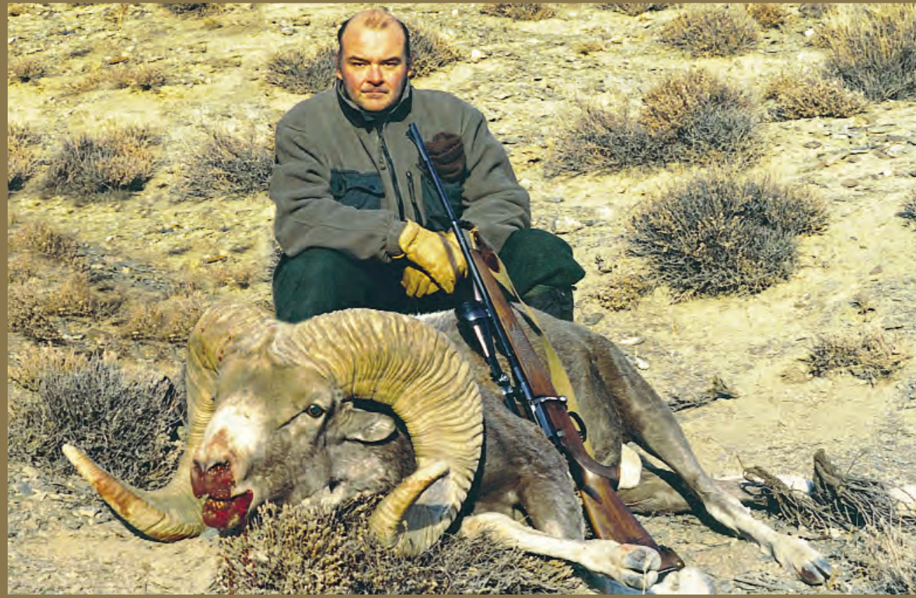
Un argali de los Altai.

horas y a veces hace una escala técnica en Moscú para recargar combustible y algún pasajero, pero sólo se baja a una sala de tránsito durante 45 minutos lo cual es agradable pues permite estirar las piernas. Podrá visitar el increíble aeropuerto de Moscú; aparte de sus múltiples tiendas de lujo, verá por qué se dice que las mujeres rusas son las más guapas del mundo, pues las jovencitas que atienden las tiendas en el aeropuerto, son realmente guapísimas. Subirá al mismo avión y en ese segundo salto de unas siete horas, aterrizará en la tierra de Genghis Khan.