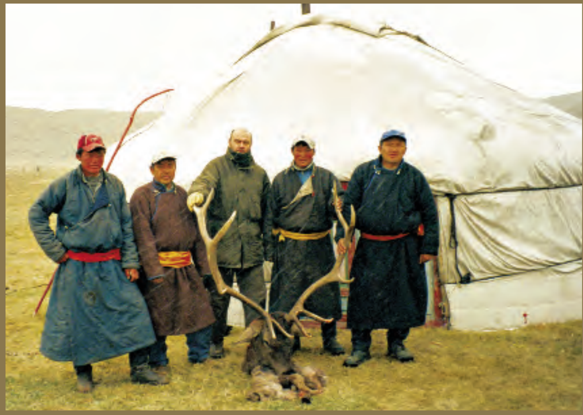
Un maral cobrado en la zona oeste de Altai.

bonito trofeo. Como le digo dependerá sobre todo de lo selectivo que usted sea y a cuántos animales les levante el rifle antes de tirar. Pero las densidades en las zonas buenas son suficientes y a veces en dos días de caza, todos mis cazadores han cobrado su íbex y a veces hasta dos trofeos. Esto es una buena práctica, pues al contrario de los carneros, los íbex son muy asequibles de precio y mucha gente cobra dos ejemplares.